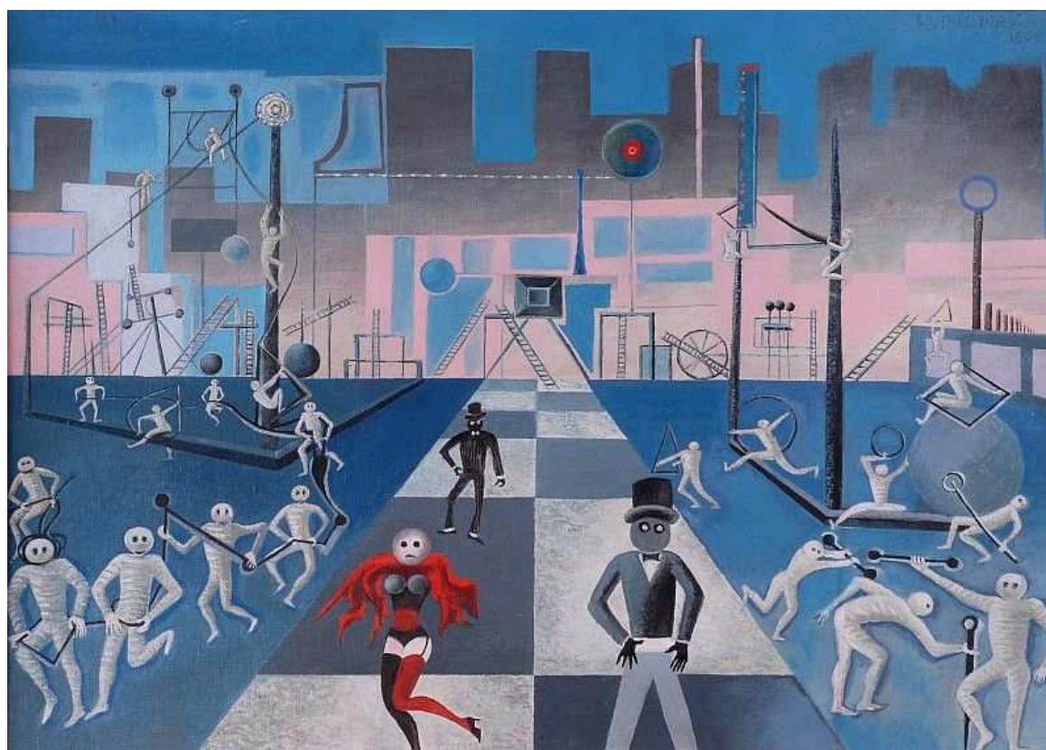
Josef Hlinomaz (1966) - Usilovná elektrifikace vesmíru

v pátek 1. listopadu 2019 — 10:00 — ČVUT, Technická 2, Praha 6 (místnost č. 80)